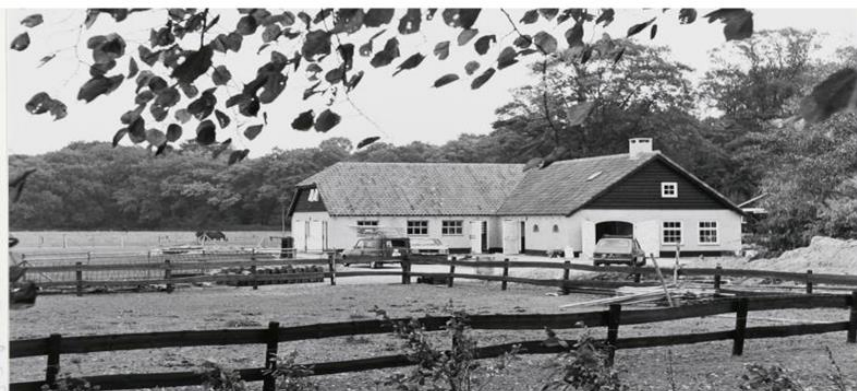
50 jaar is Boerderij Wolfslaar nog steeds de plek waar de inwoners van Breda en van ver daaroverheen, genieten van het buiten zijn, de dieren en het groen en de heerlijkheden van het Tuinhuis. We blijven eraan werken dat iedereen na een bezoek aan Boerderij Wolfslaar een klein stukje van Boerderij Wolfslaar meeneemt in de vorm van een moment van inspiratie, een stukje kennis of een andere manier verbonden voelt/zijn met Boerderij Wolfslaar. De plek 'waar buiten binnen komt'...

Op 29 september jl. hebben we het 50-jarige bestaan van Boerderij Wolfslaar gevierd met een grote presentatie van alle samenwerkende partijen en hun activiteiten in de Boerderij. Zo'n beetje iedereen had wel een standje, er werden etenswaren bereid, producten getoond, foto's gemaakt en kennis gedeeld met de bezoekers groot en klein. Ondanks het slechte weer